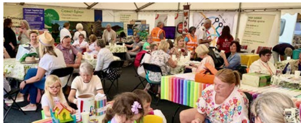
Bwrlwm yn y babell: gwaith plant yn y blaen ac oedolion yn mwynhau paned a sgwrs yn y cefn