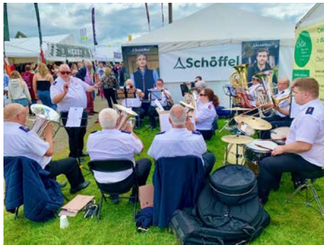
Band Byddin yr Iachawdwriaeth yn arwain yr addoliad ar y bore Mawrth