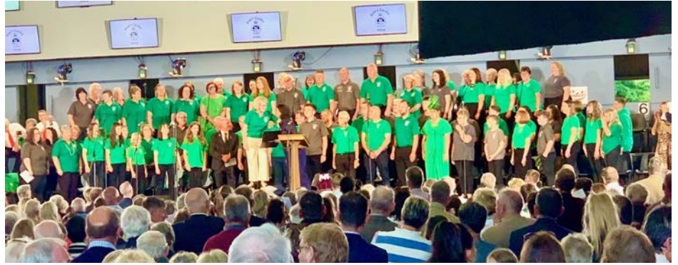
Moliant y Maes yng ngofal côr o bobl oedd wedi dod ynghyd o wahanol ardaloedd Ceredigion. Braff oedd gweld y sied dan ei sang gyda nifer yn sefyll o gwmpas yr ymylon

Yn ôl yr arfer, roedd presenoldeb yr eglwysi yn amlwg ar faes y Sioe Fawr yn Llanelwedd yn ddiweddar, a hynny drwy ymroddiad y tîm o gaplaniaid oedd yn cerdded maes y sioe o fore tan nos yn cyfarfod ac yn sgwrsio â phobl. Yn ogystal â hynny, roedd gan Cytûn eu stonidin arferol yn dystiolaeth o waith yr eglwysi. Braff cofio hefyd fod y sioe yn dechrau ag oedfa yn y dref, ac yn dilyn hynny Cymanfa Ganu Moliant y Maes yn y sied ddefaid. Dyma bigion o'r hyn a ddigwyddodd ar y maes eleni.