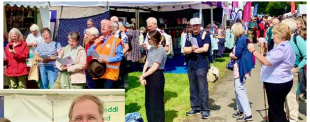
Y gynulleidfa o flaen y babell yn ystod oedfa'r bore