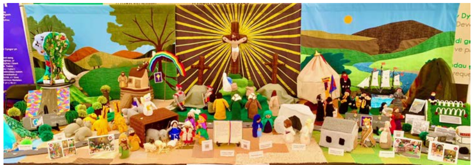
Arddangosfa 'Beibl mewn Gwlân' gan Fyddin yr Iachawdwriaeth fel rhan o'i dathliadau i nodi 150 mlynedd o weithio yng Nghymru