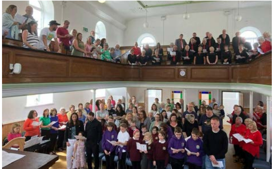
Cymanfa Ganu yn Seion, Waunarllwydd, un o gapeli'r Bedyddwyr

Fe waethygodd pethau, a daeth tro ar fyd hyd yn oed ymhlith y Cymry Cymraeg. Gwagiodd ein capeli, dilëwyd dysgu solffa o gwricwlwm ysgol ac ysgol Sul, ac