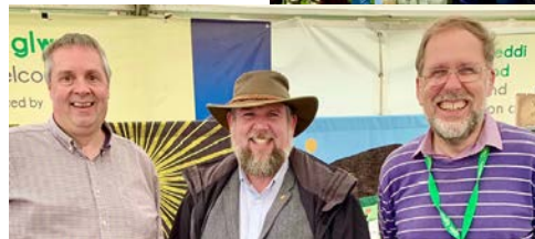
Aled Davies a Gethin Rhys yn croesawu Peredur Owen Griffiths, AS, i mewn i'r babell – yntau wedi bod yn gyfrifol am drefnu'r babell yn y gorffennol. Daeth nifer o Aelodau'r Senedd a'r Llywodraeth i'n gweld yn ystod yr wythnos.